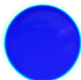
絵皿に溜まった状態