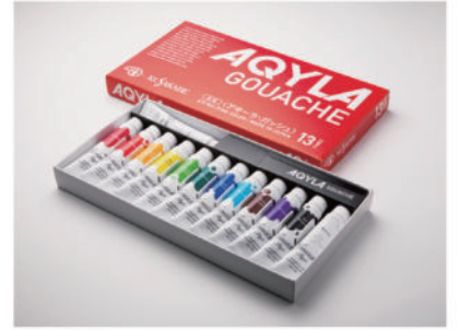
13本セット 11ml (12色セット+ホワイト1本追加) 税込価格 1,848円 (本体価格 1,680円)

EXCEL SET (エクセルセット) 税込価格 2,717円 (本体価格 2,470円) 絵具(11ml)11色+ホワイト(20ml)1本、筆3本【彩色筆、平筆、面相筆】、パレット、フキン付