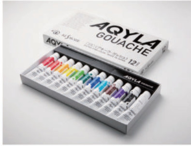
12色セット 11ml 税込価格 1,738円 (本体価格 1,580円)